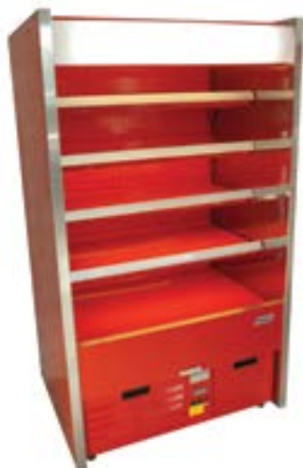
Wersja z bokiem prostym