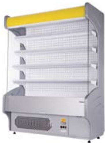
Wersja z bokiem przeszklonym