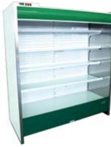
wersja z bokiem prostym