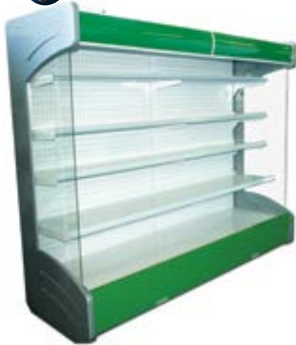
wersja z bokiem przeszklonym