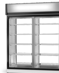
model 2SR/AG/1D R-290/ ecoline /standard