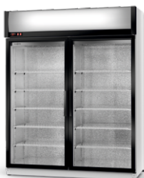
model S/AG R-290/ ecoline /standard