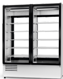
model 2SR R-290/ ecoline /standard