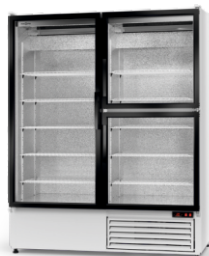
model S/3D R-290/ ecoline /standard