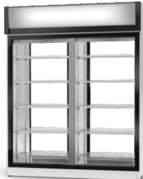
model 2S/AG/1D R-290/ ecoline /standard