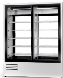
model 2S2R R-290/ ecoline /standard