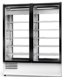
model 2S R-290/ ecoline /standard