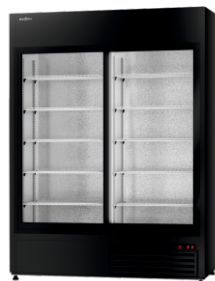
model SR/WH R-290/standard