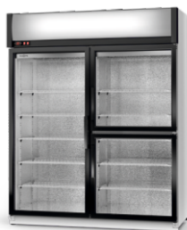
model S/AG/3D R-290/ ecoline /standard