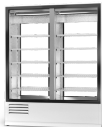
model 2SR/1D; 2S/1D R-290/ ecoline /standard