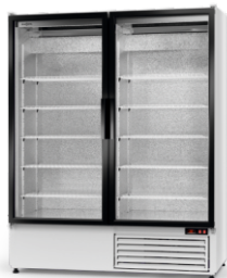
model S R-290/ ecoline /standard