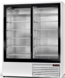
model SR R-290/ ecoline /standard