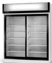
model SR/AG R-290/ ecoline /standard