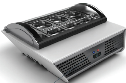
Regulowany termostat elektroniczny