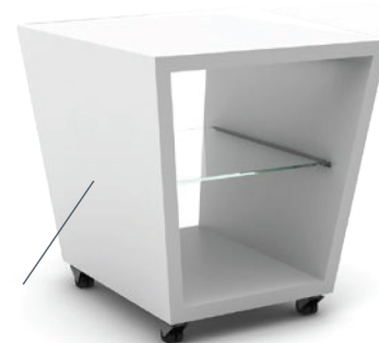
Podstawa Cena: 3 410 zł